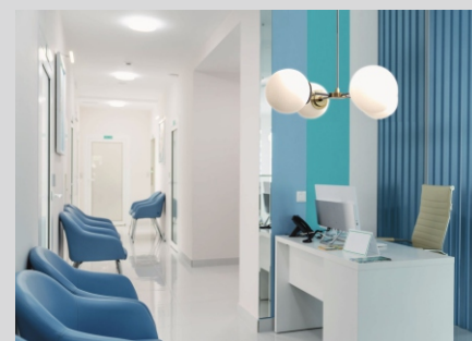
Projekt LAKO LAKO project

Tolerancja strumienia świetlnego i mocy +/- 10% Producent zastrzega sobie możliwość zmian konstrukcyjnych oprawy. Istnieje możliwość modyfikacji produktu na życzenie Klienta. Informacje zawarte na karcie katalogowej nie stanowią oferty handlowej ani elementu umowy. Więcej na temat rodziny produktów, znajduje się na stronie: www.lako.pl