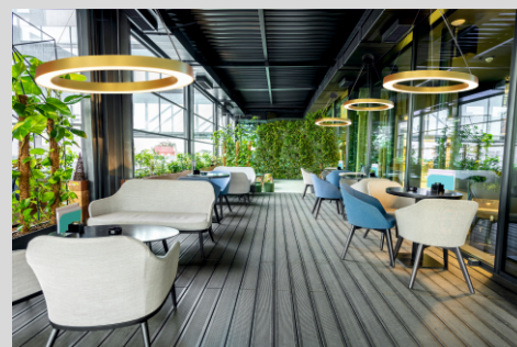
Projekt LAKO LAKO project