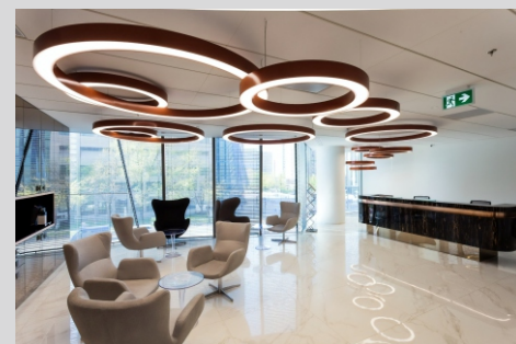
Wieżowiec biurowy Q22, Warszawa Q22 office tower, Warsaw

Tolerancja strumienia świetlnego i mocy +/- 10% Producent zastrzega sobie możliwość zmian konstrukcyjnych oprawy. Istnieje możliwość modyfikacji produktu na życzenie Klienta. Informacje zawarte na karcie katalogowej nie stanowią oferty handlowej ani elementu umowy. Więcej na temat rodziny produktów, znajduje się na stronie: www.lako.pl